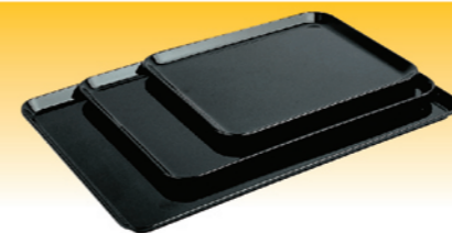
SN4387 美耐托盘(黑色) 270x210x17 SN4388 美耐托盘(黑色) 350x240x17 SN4389 美耐托盘(黑色) 420x280x20