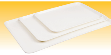
SN4327 美耐托盘(米白) 270x210x17 SN4328 美耐托盘(米白) 350x240x17 SN4329 美耐托盘(米白) 420x280x20