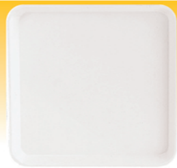
SN4335 塑料方盘(米白) 330x330x25