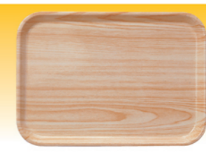
SN4356 美耐托盘(木纹) 383x280x22 SN4357 美耐托盘(木纹) 415x305x23