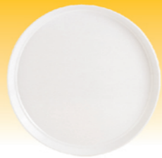
SN4331 塑料圆盘(米白) 直径320x27