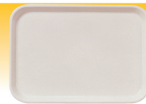
SN4311 美耐托盘(米白) 340x240x22 SN4312 美耐托盘(米白) 383x280x22 SN4313 美耐托盘(米白) 415x305x23 SN4314 美耐托盘(米白) 450x340x25