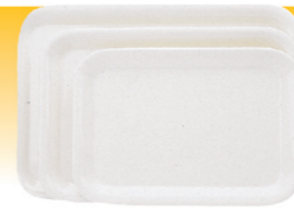
SN4307 美耐托盘(米白) 330x250x21 SN4308 美耐托盘(米白) 380x290x24 SN4309 美耐托盘(米白) 430x330x24