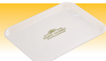
SN4371 美耐托盘(麦穗) 340x240x22 SN4372 美耐托盘(麦穗) 383x280x22 SN4373 美耐托盘(麦穗) 415x305x23 SN4374 美耐托盘(麦穗) 450x340x25 SN4375 美耐托盘(麦穗) 380x280x18