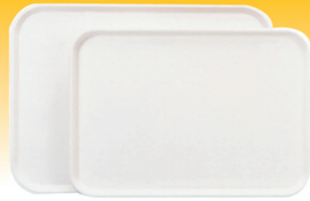
SN4322 塑料托盘(米白) 412x300x22 SN4323 塑料托盘(米白) 455x342x21