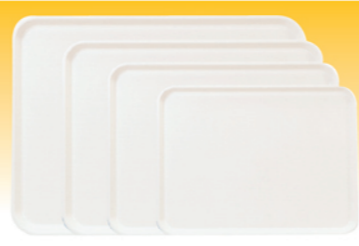
SN4343 15"塑料托盘(米白) 381x286x21 SN4344 16"塑料托盘(米白) 406x305x21 SN4345 17"塑料托盘(米白) 432x324x21 SN4346 18"塑料托盘(米白) 460x345x24