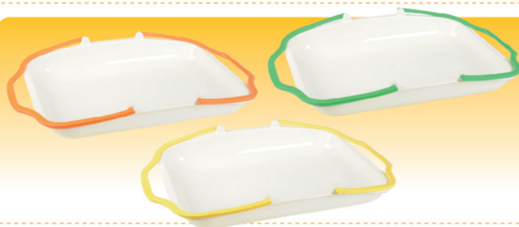
SN4336 提篮式塑料托盘(米白—黄) 400x300x60 SN4337 提篮式塑料托盘(米白—绿) 400x300x60 SN4339 提篮式塑料托盘(米白—橘) 400x300x60