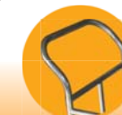
手柄设计: 符合人体工学, 省时、省力