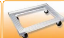
SN1987 铝合金平台车(阳极) 620x420x135 耐重: 250kg