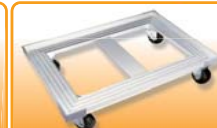
SN1985 铝合金平台车(阳极) 725x470x135 耐重: 250kg