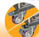
脚轮设计: 活动双刹聚氨酯轮, 亦可为您量身定制。