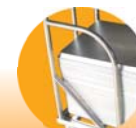
档杆设计: 防止烤盘左右晃动或转弯时侧倾洒落。